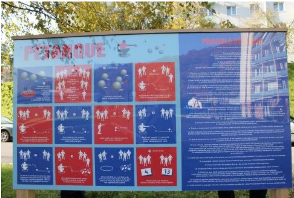
Tabuľa s pravidlami. Hra je určená pre dve jeden až trojčlenné družstvá.

Petang pochádza z Francúzska, je určený pre dve jeden až trojčlenné družstvá, ktoré sa snažia umiestniť kovové gule čo najbližšie k cieľu. Ten tvorí drevená guľička.