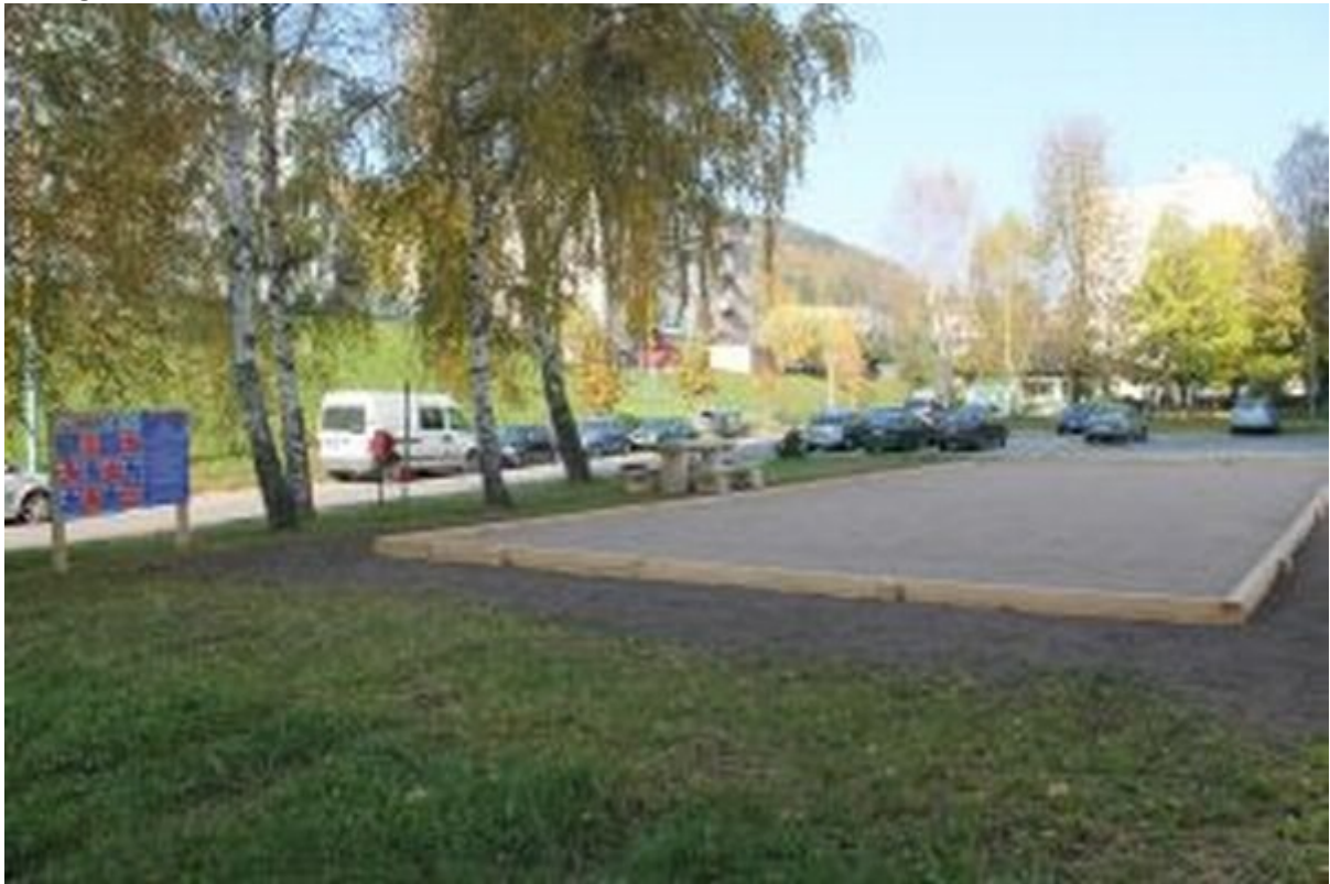
Petangové ihrisko – ilustračné foto

Petang pochádza z Francúzska, je určený pre dve jeden až trojčlenné družstvá, ktoré sa snažia umiestniť kovové gule čo najbližšie k cieľu. Ten tvorí drevená guľička.