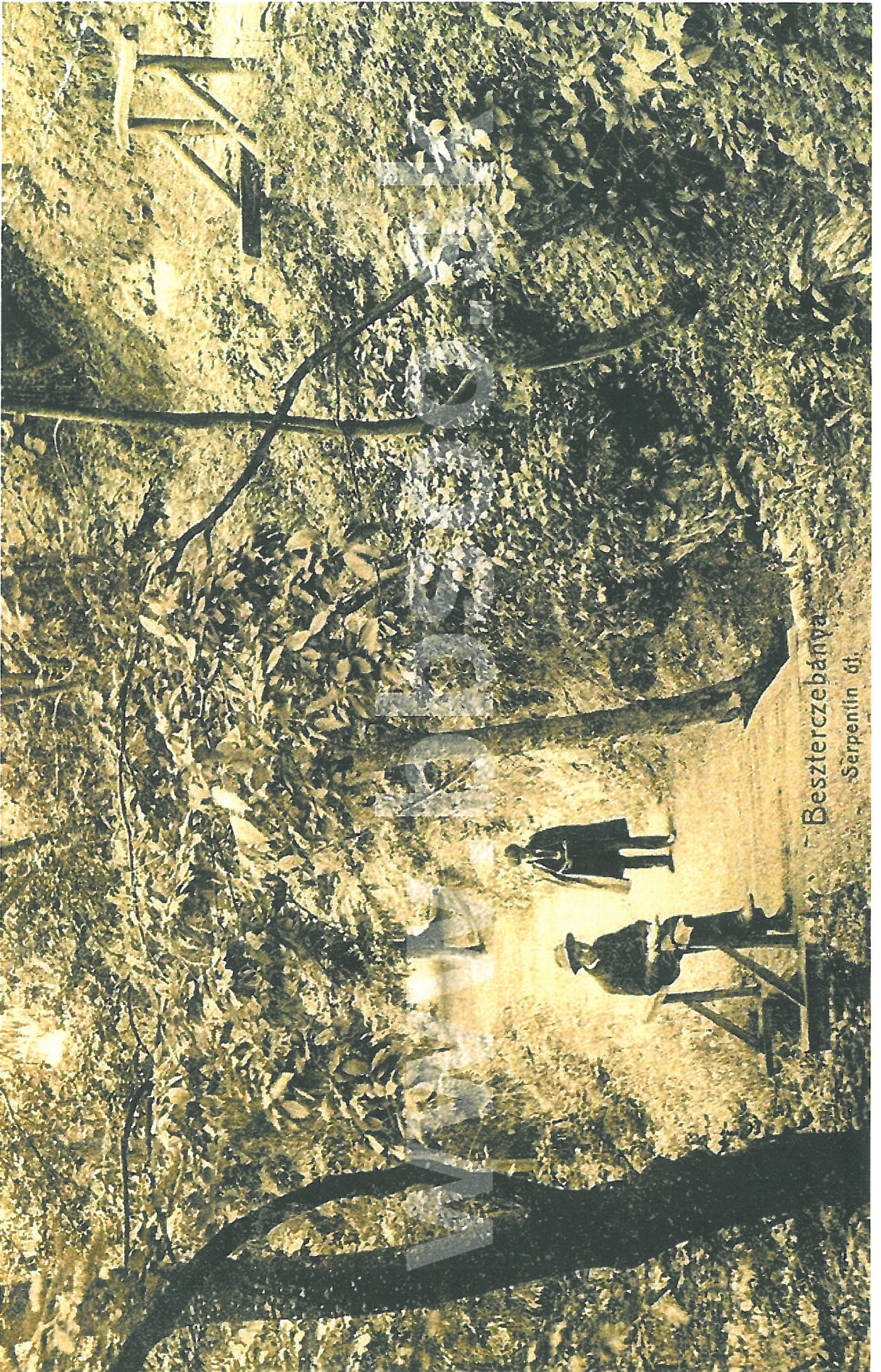
Besztercebánya Serpentin út.