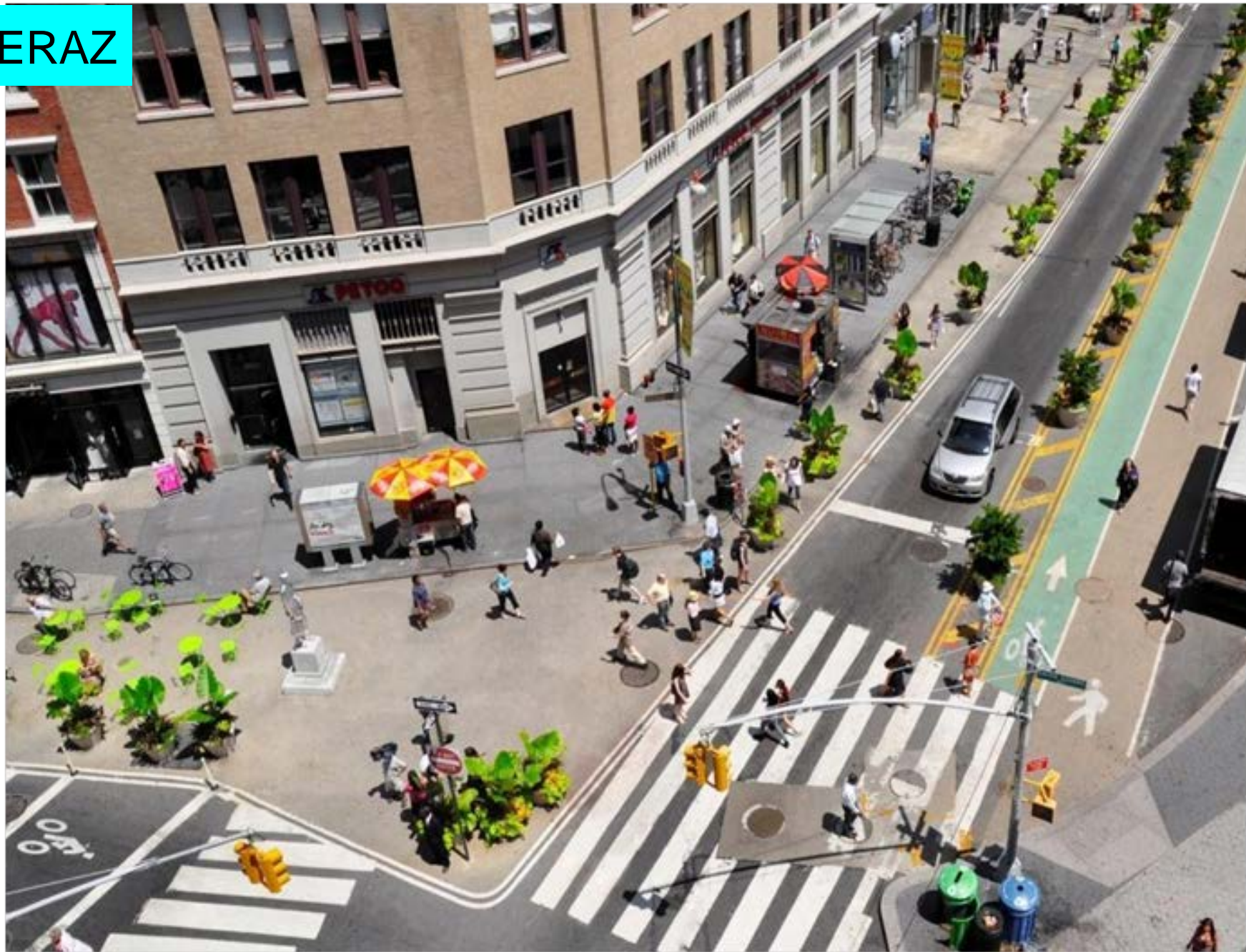
Union Square v New Yorku