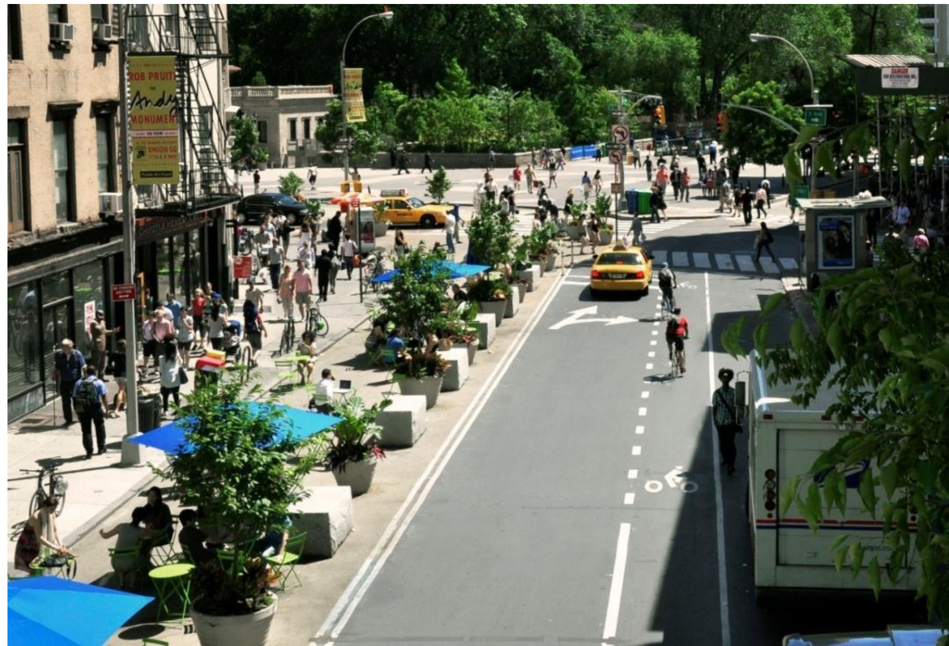
Union Square v New Yorku