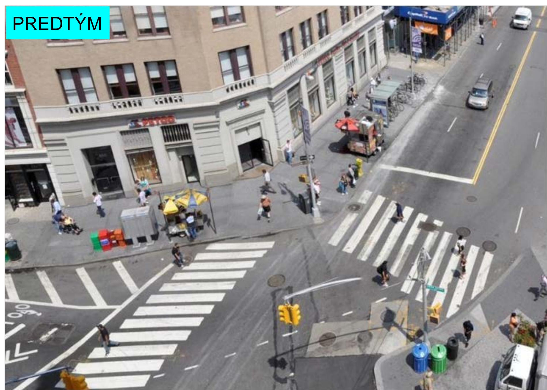
Union Square v New Yorku