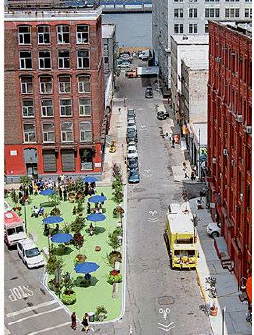
Pearl Street Triangle, New York