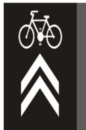
V 8c Koridor pre cyklistov

Možné použitie v Bratislave môže byť napr. v Líščom údolí na križovatkách.