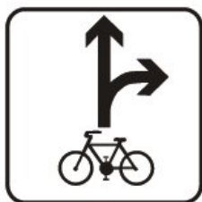
E 16a Povolený smer jazdy cyklistov

Dodatková tabuľka Priečna jazda cyklistov (č. E 16d) sa používa najmä v kombinácii so značkami č. A 16, č. P 1 alebo č. P 2, pričom ak je umiestnená pod značkou č. P 1 alebo č. P 2, nielen upozorňuje na priečnu jazdu cyklistov, ale tiež zdôrazňuje vodičovi povinnosť dať prednosť v jazde vyplývajúcu z príslušnej značky aj cyklistom idúcim po cestičke pre cyklistov v pridruženom dopravnom priestore hlavnej cesty.“