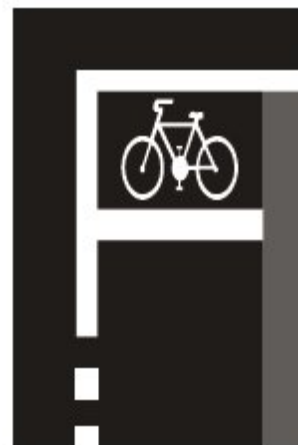
V 5d Priestor pre cyklistov

V Bratislave je možná aplikácia na väčšine hlavných ciest so svetelne riadenými križovatkami, najmä tam, kde je cyklotrasa vedená ako cyklopruh vo vozovke. Príkladom môže byť križovatka Košickej ulice s Prievozkou.