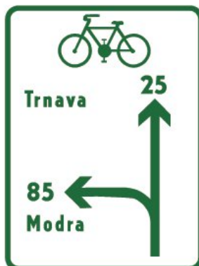
IS 40e Návesť pred križovatkou pre cyklistov