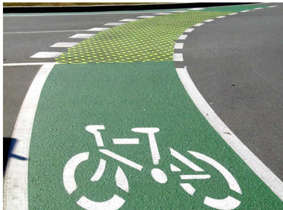
Odporúčaná farebná schéma