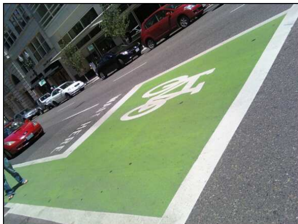
Priestor pre cyklistov