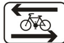
E 16d Priečna jazda cyklistov