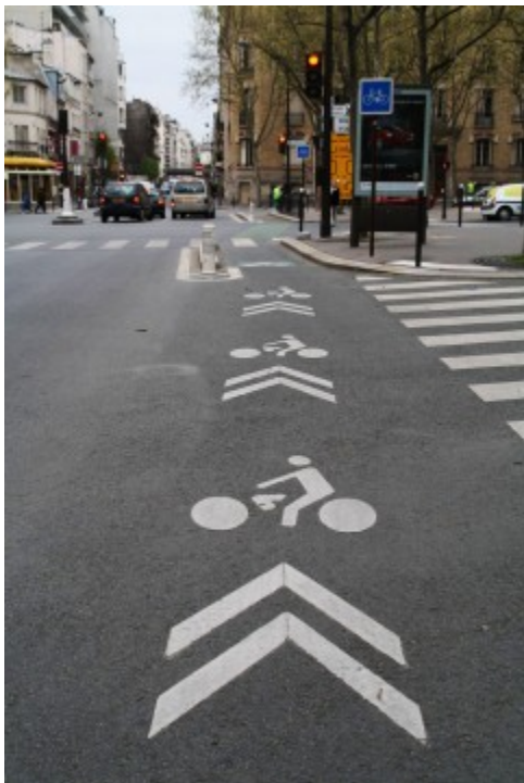
Cyklokoridor v Paríži